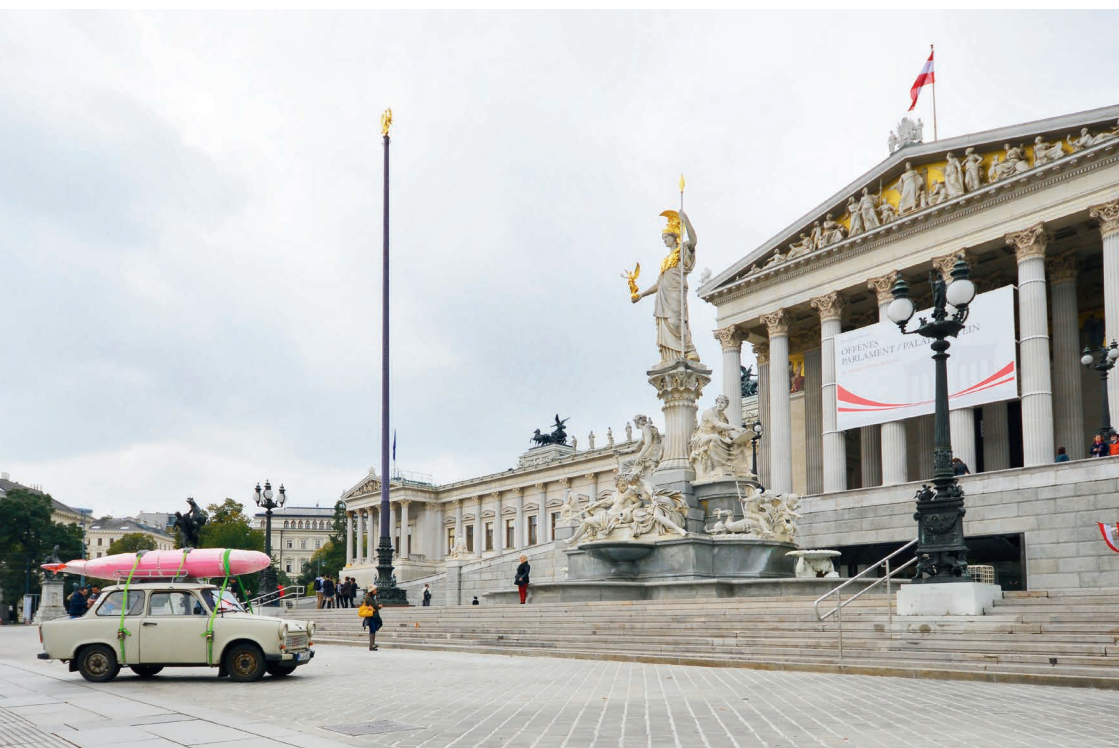
Illustration (left): In front of the Austrian Parliament in Vienna